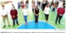
MEXICALI. - Se celebra el aniversario de la creación del Estado de Baja California y se conmemora el día de la Independencia de México.

Mexicali. - El gobierno estatal logró abatir 100 delincuentes en el mes de septiembre, con cada 20 horas de operatividad se logró abatir un delincuente.