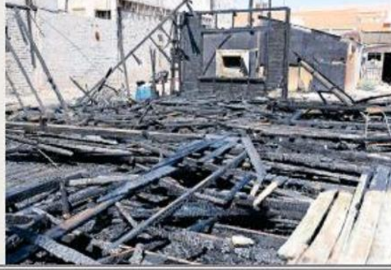
MEXICALI, BAJA CALIFORNIA

Un incendio consumió ayer la casa de madera de la zona centro en la que vivió el coronel Esteban Cantú Jiménez, quien fue gobernador del entonces territorio norte de Baja California. Cantú Jiménez nació en Linares, Nuevo León, en 1881 y llegó a esta frontera en 1911, enviado por el gobierno federal para combatir la insurrección de los hermanos Flores Magón y desde entonces se quedó a vivir en Mexicali, donde falleció el 15 de marzo de 1966.