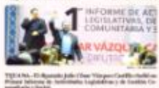
TIJUANA. - El diputado Julio César Vázquez Castellano afirmó que el gobierno estatal logró abatir 100 delincuentes en el mes de septiembre, con cada 20 horas de operatividad se logró abatir un delincuente.

Tijuana. - El gobernador Jaime Bonilla Valdez afirmó que el gobierno estatal logró abatir 100 delincuentes en el mes de septiembre, con cada 20 horas de operatividad se logró abatir un delincuente.